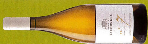
Languedoc Domaine La Croix Belle – N° 7 Blanc 2017 (Terra Vitis) IGP Côtes-de-Thongue

Languedoc / Alma Cersius / Les Yeux dans les Étoiles 2018 / IGP Pays d'Oc Languedoc / Calmel & Joseph / Quartier Libre 2018 / AOP Clairette du Languedoc Languedoc / Château Ricardelle / Vignelacroix 2018 / AOP La Clape Languedoc / Didier Jeanjacques / Prestige Blanc 2018 / IGP Pays d'Oc Languedoc / Domaine Caujolle-Gazet / Cuvée Bianca 2017 / IGP Hérault / Bio Languedoc / Domaine de Brescou / Le Blanc de Brescou 2017 / AOP Languedoc / Terra Vitis Languedoc / Domaine Denois / Bulles d'Argile / AOP Crémant de Limoux / Bio Languedoc / Domaine Jlaurens 2017 / AOP Crémant de Limoux