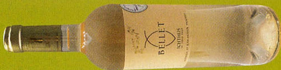
Provence Domaine Saint Jean – Cuvée Ichthus 2018 (AB) AOP Bellet

Languedoc / Domaine Ollier Taillefer / Allégro 2018 / AOP Faugères / Bio Languedoc / Les Artisans bio / Blanc Or 2018 / AOP Languedoc / Biodynamie Languedoc / Les Costières de Pomerols / Moelleux Blanc Cuvée Beauvignac 2018 / IGP Côtes-de-Thau Languedoc / Les Vignerons de Florensac / Picpoul de Pinet 2018 / AOP Picpoul de Pinet Languedoc / Les Vignobles Foncalieu / Le Versant 2018 / IGP Pays d'Oc Languedoc / Maison Antech / Crémant Héritage Antech Brut 2016 / AOP Crémant de Limoux / Terra Vitis Languedoc / Mas de Valbrune / L'Adorer 2017 / AOP Clairette du Languedoc Languedoc / Mas Saint Laurent / Le Ginestet 2017 / AOP Picpoul de Pinet Languedoc / Sieur d'Arques / Château de Flandry 2017 / AOP Limoux Provence / Château de Brégançon / La Réserve 2018 / AOP Côtes-de-Provence / HVE