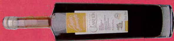
Languedoc Domaine de Clarmon Cuvée Grappe Gourmande 2016 (AB) Vin de Liqueur

Provence / Château du Rouët / Estérelle 2018 / AOP Côtes-de-Provence Provence / Château Saint-Esprit / Château Saint-Esprit - Signature 2018 / AOP Côtes-de-Provence Provence / Clos Saint Pierre / Légende 2018 / AOP Côtes-de-Provence Provence / Figuière / Première Rosé 2018 / AOP Côtes-de-Provence / Bio Provence / Le Cellier des 3 Collines / Vitis N°3 2018 / AOP Côtes-de-Provence